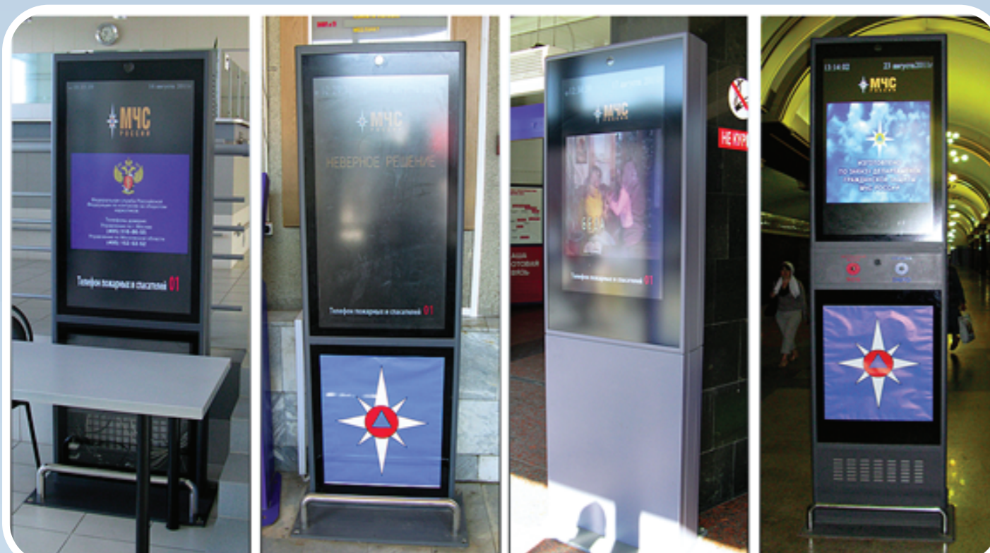
Терминальные комплексы СЗИОНТ