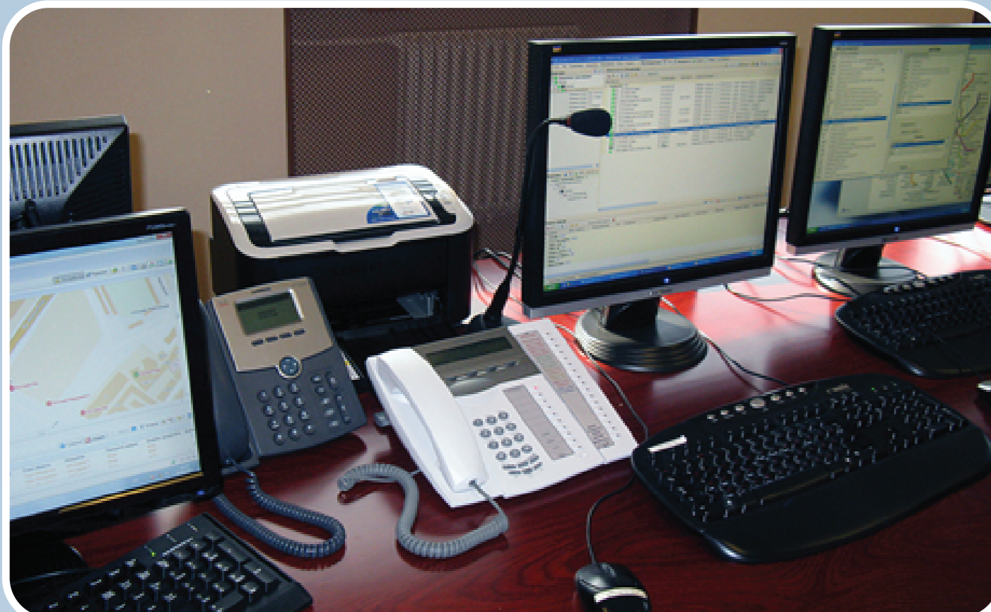
Автоматизированное рабочее место ситуационного центра СЗИОНТ

повседневный; угрозы или возникновения ЧС; послекризисный